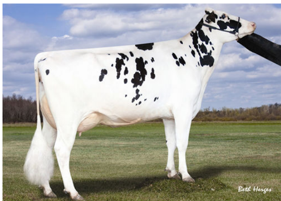
RABUR S PADORA